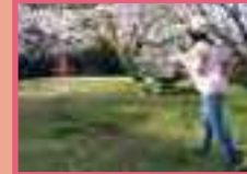
⑫ ウォーキング コース