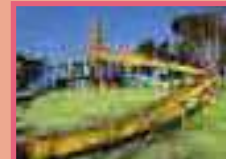
⑧ マウンテンバイクパーク