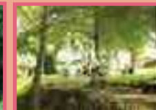
⑪ サイクリングコース