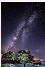
(海部門グランプリ)